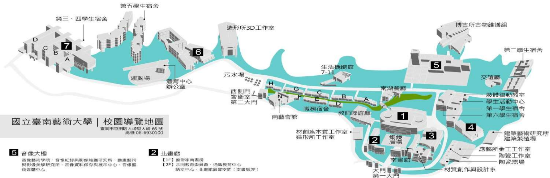
國立臺南藝術大學 | 校園導覽地圖 臺南市官田區大崎里大崎 66 號 總機 06-6930100