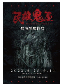
民雄鬼屋實境體驗特展